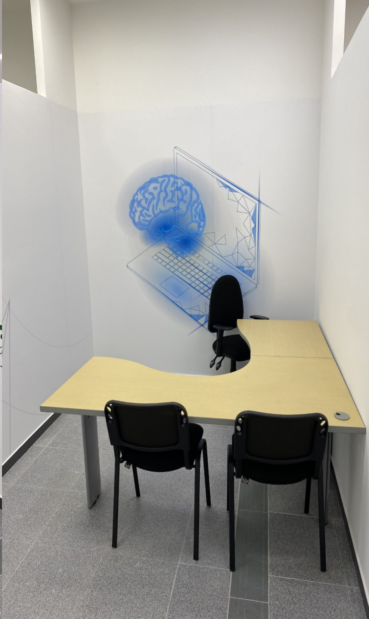
Cámara de Comercio de Bucaramanga