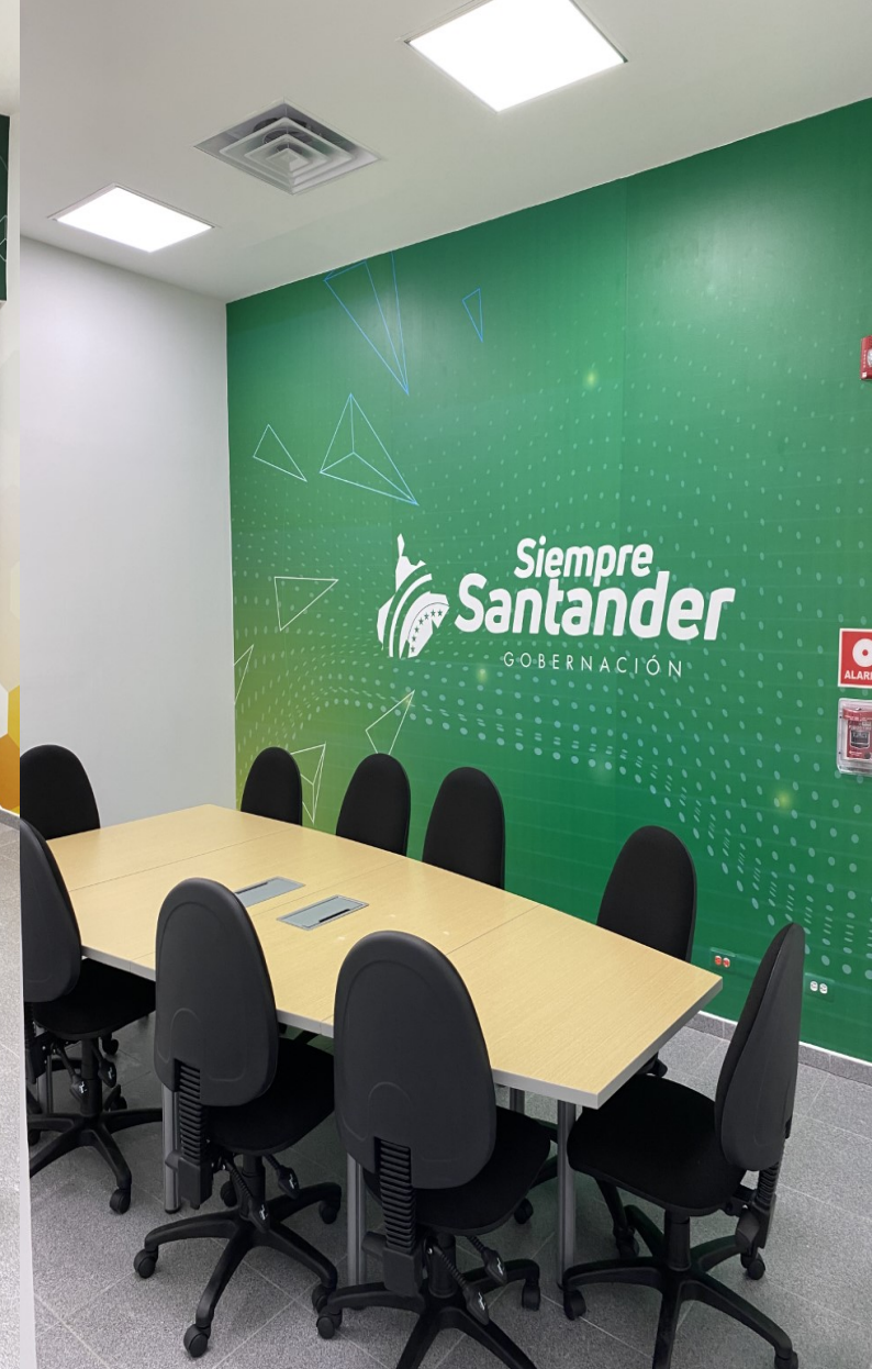
Sala de juntas