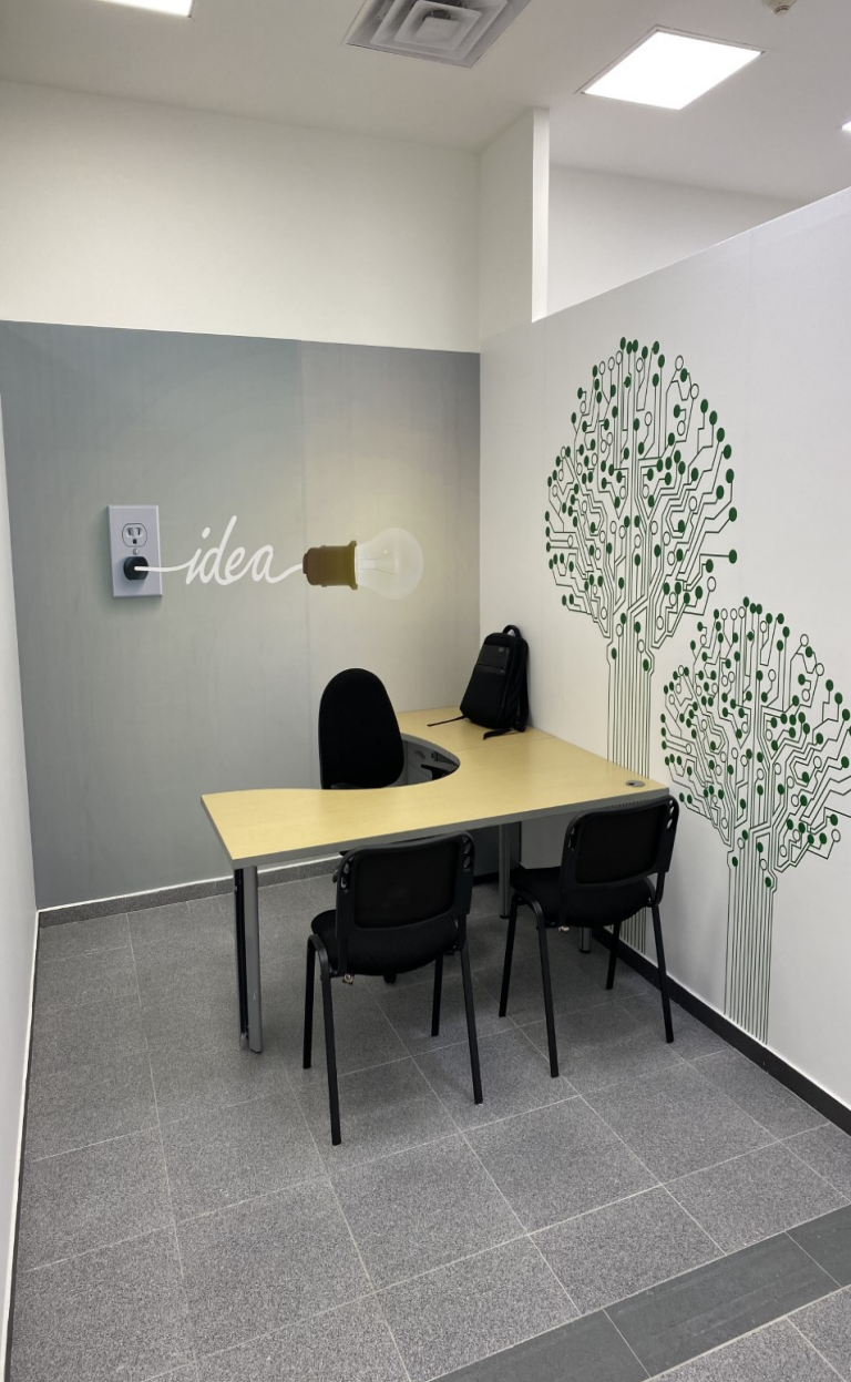
Dirección de productividad y competitividad