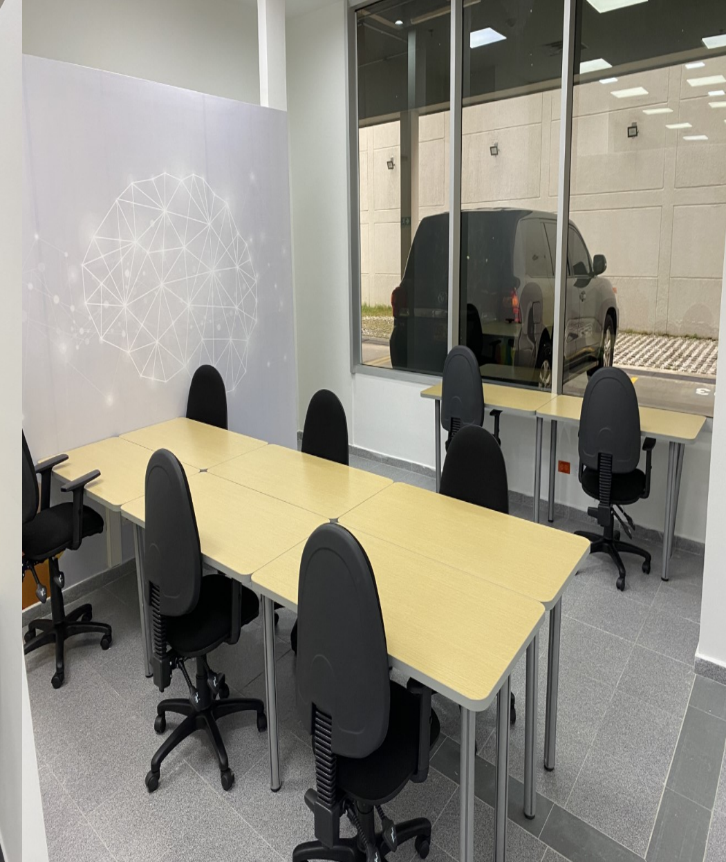
Unidades Tecnológicas de Santander