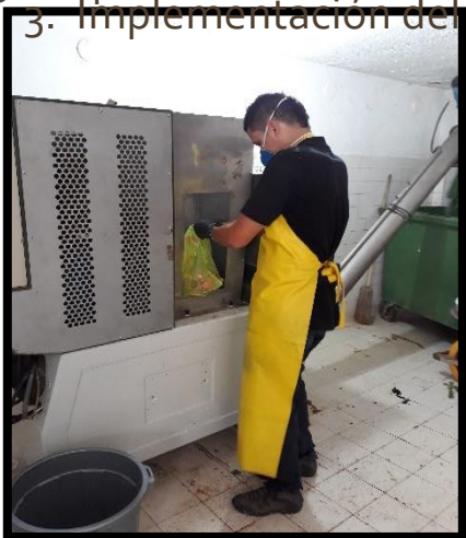
3. Implementación del Sistema