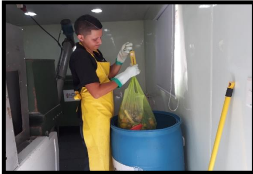
2. Separación en la fuente