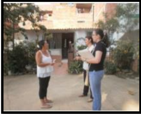
1. Educación Ambiental