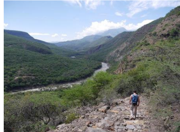
Camino de Lengerke