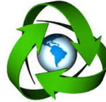
Centro de Valoración de Residuos