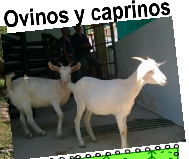
Ovinos y caprinos